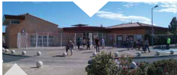
◆ LE GROUPE SCOLAIRE « LES FAÏSSES »