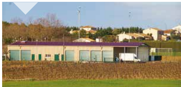
◆ LES ATELIERS MUNICIPAUX