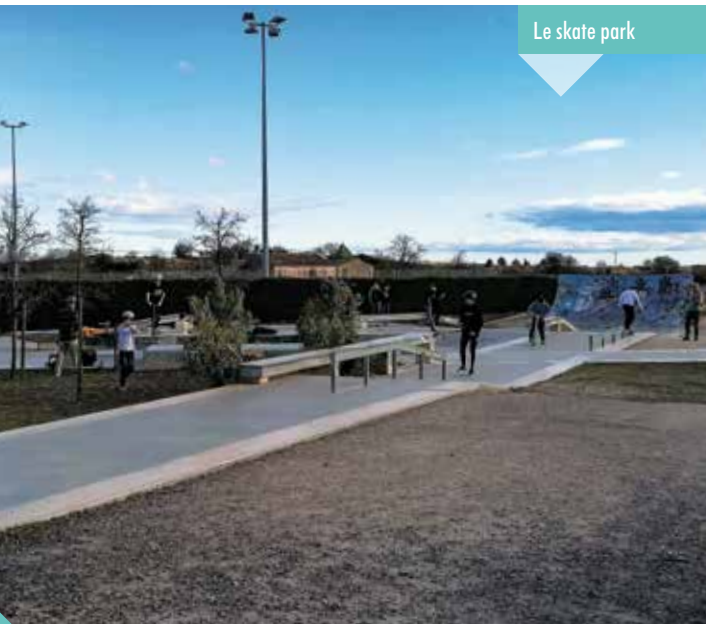
Le skate park