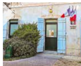
◆ LA MÉDIATHÈQUE