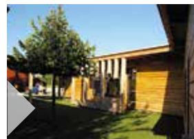
◆ LE CENTRE DE LOISIRS